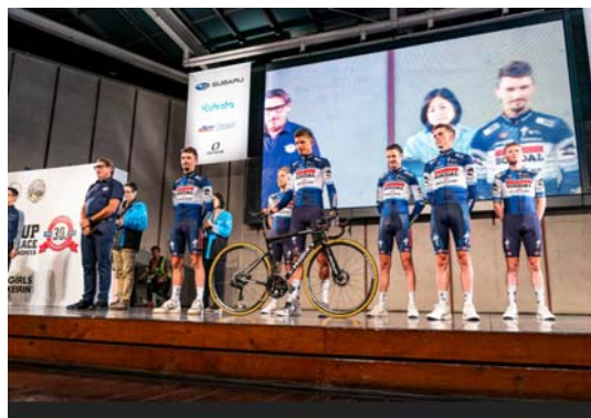
チーム紹介の様子