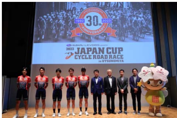
「記者発表会」の開催