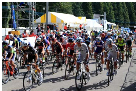
アマチュアレースの様子