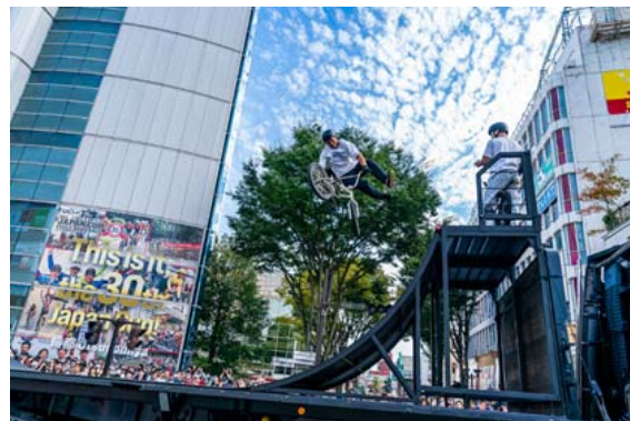
「BMXパフォーマンス」の実施