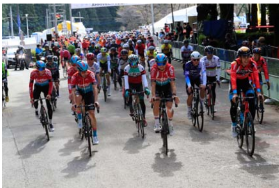
オープニングフリーランの様子