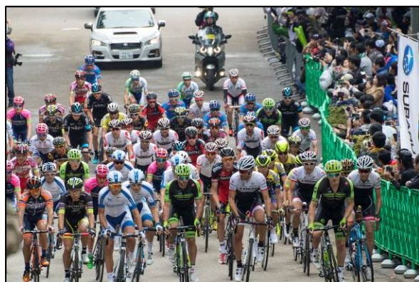
森林公園スタート後の様子 (ロードレース)

10月18日 2015ジャパンカップサイクルロードレース (宇都宮市森林公園／国際レース)