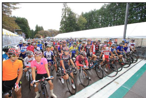
スタート前の様子(オープンレース)