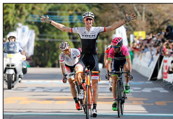
ゴール時の様子(ロードレース)