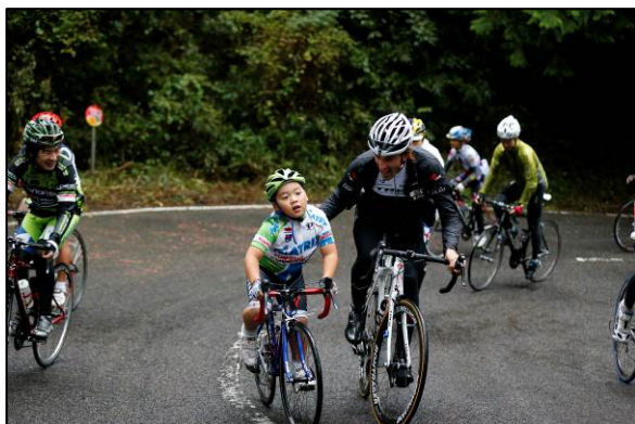
トップ選手と参加者が触れ合う様子(フリーラン)

10月17日 一般愛好家による自転車走行イベント (フリーラン：宇都宮市森林公園) JCF登録競技者による男女別レース (チャレンジレース, オープンレース：宇都宮市森林公園) 2015ジャパンカップクリテリウム (宇都宮市市内中心部大通り)