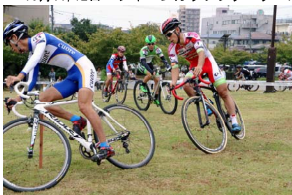
宇都宮城址公園ステージ