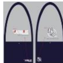
オリジナルサコッシュ